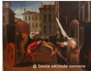
Claude Gillot (Langres, 1673 - Paris, 1722) Les deux carrosses , vers 1707 Musée du Louvre

Elle a été, dans un premier temps, attribuée à Gillot, connu pour ses représentations d'acteurs. Son tableau le plus célèbre, Les deux carrosses , représente Arlequin et Scaramouche déguisés en femmes se querellant depuis un carrosse.