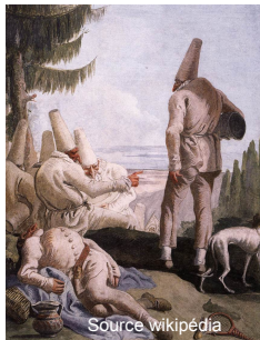
Giambattista Tiepolo Le départ de Polichinelle Fresque, 1797 Venise, La'Rezzonico

Les artistes du XVIII e siècle aimaient représenter des personnages de théâtre, dont ceux de la commedia dell'arte , comme nous le prouvent notamment les compositions des artistes Watteau et Tiepolo. En France ce siècle fut, peut-être plus encore que les autres, celui du triomphe du masque et de la fête. Les gravures de Beauvarlet d'après Jean-François de Troyes, accrochées dans cet espace, représentent ainsi des