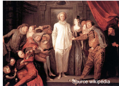
Jean-Antoine Watteau (Valenciennes, 1684 – Nogent-sur-Marne, 1721) Les Comédiens italiens 1720 National Gallery of Art (Washington, USA)

jeunes gens de la haute société se préparant et revenant d'un bal, dans une débauche de froufrous et de masques qui ne sont plus ceux du théâtre mais ceux d'une coquetterie empreinte de mystère très en vogue à l'époque.