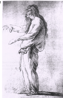
@ Pontoise, musée Tavet-Delacourt Carle Vanloo (Nice 1705 - Paris 1765) Polichinelle Pierre noire, rehauts de craie blanche sur papier bleu, 1730 Pontoise, musée Tavet-Delacourt

Un rapprochement avec un tableau de Nice signé par Carle Vanloo ainsi que la découverte, à Pontoise, d'un dessin de ce même artiste représentant tous deux le personnage de Polichinelle ont permis de placer l'œuvre d'Abbeville dans le cercle de Carle Vanloo. Cependant, reste à savoir s'il s'agit-il d'une œuvre non signée de l'artiste lui-même (hypothèse majoritairement écartée), d'une œuvre produite dans son atelier, d'un tableau inspiré par une de ses compositions ou simplement de l'œuvre d'un autre artiste du XVIII e siècle ayant les mêmes sources d'inspiration. Le