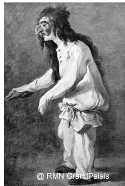
Carle Vanloo (Nice 1705 - Paris 1765) Polichinelle Nice, musée Chéret

Un rapprochement avec un tableau de Nice signé par Carle Vanloo ainsi que la découverte, à Pontoise, d'un dessin de ce même artiste représentant tous deux le personnage de Polichinelle ont permis de placer l'œuvre d'Abbeville dans le cercle de Carle Vanloo. Cependant, reste à savoir s'il s'agit-il d'une œuvre non signée de l'artiste lui-même (hypothèse majoritairement écartée), d'une œuvre produite dans son atelier, d'un tableau inspiré par une de ses compositions ou simplement de l'œuvre d'un autre artiste du XVIII e siècle ayant les mêmes sources d'inspiration. Le